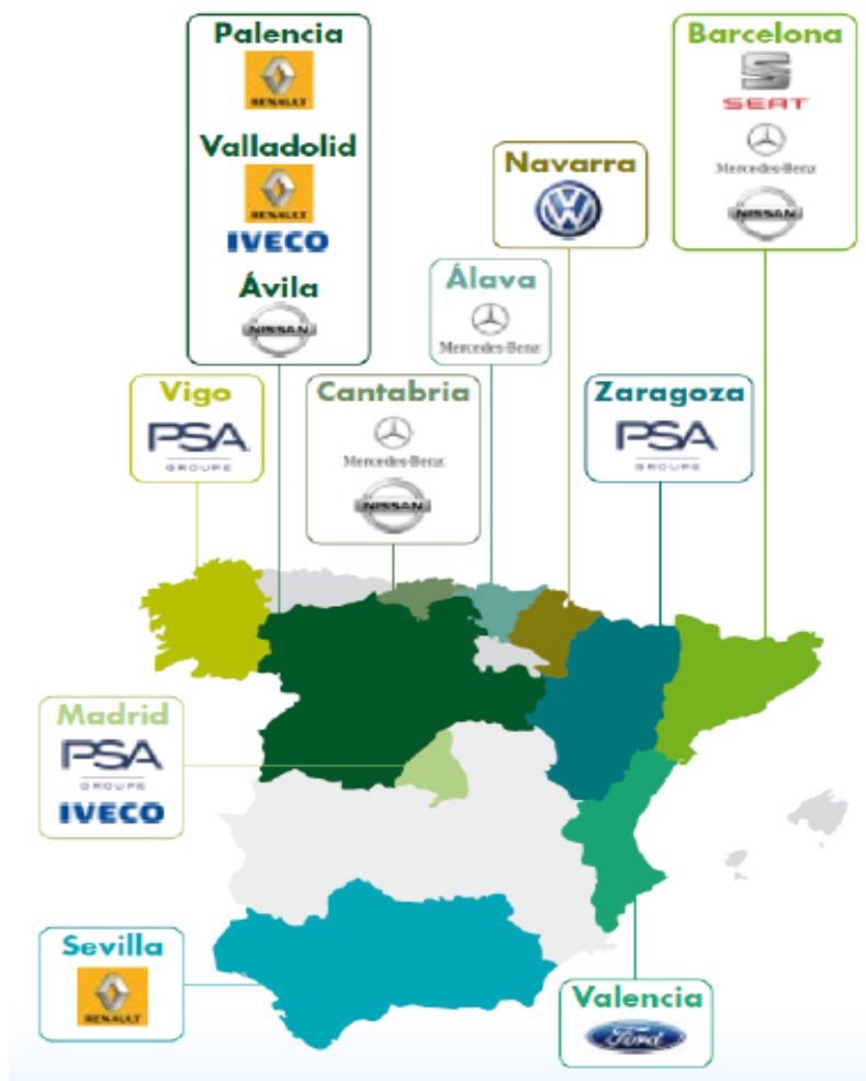
Fig.2. Fabryki i producenci samochodów na terenie Hiszpanii.