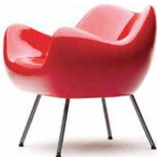
© Дизайнер: Roman Modzelewski chair (RM58) by Vzor

Промышленный дизайн является средством передачи эстетических ценностей, он предусматривает популяризацию символов, знаков и традиций, которые создают индивидуальность страны и народа. Он помогает отождествлять продукты с их родной страной. Он также усиливает экономические отношения и является важным стимулом для нынешнего и будущего торгового обмена.