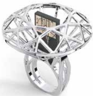
© Дизайнер: Marcin Nowak

Промышленный дизайн является средством передачи эстетических ценностей, он предусматривает популяризацию символов, знаков и традиций, которые создают индивидуальность страны и народа. Он помогает отождествлять продукты с их родной страной. Он также усиливает экономические отношения и является важным стимулом для нынешнего и будущего торгового обмена.