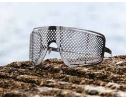
© Дизайнер: Slav Novosad

На выставке представлены более 450 изделий, разработанных в Польше более 100 компаниями и отдельными художниками. Среди представленных изделий: ювелирные изделия, изделия из янтаря и черного дуба, фарфор, мебель, художественное и промышленное стекло, ковры, светильники, игрушки, велосипеды, элементы внутреннего дизайна и многое другое.