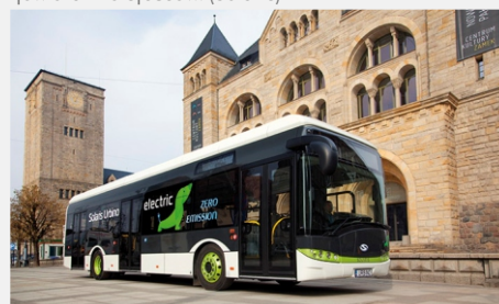
Solaris Urbino Electric

wypuszcza na rynek 1 300 sztuk pojazdów rocznie. Solaris Bus & Coach jest polską firmą i jednym z wiodących w Europie producentem autobusów, tramwajów oraz trolejbusów. (Solaris)