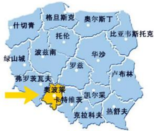
奥波莱省在波兰的位置