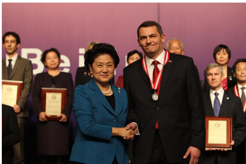
2012 年 12 月刘延东国务委员因奥波莱省对孔子学院的支持为省长先生颁奖

奥波莱省的外经贸官员中有一部分接受过中国波兰跨文化商务管理的培训，他们了解中国的历史文化和商业运作，能够为初到的中国企业创造良好的环境并提供有效的帮助。