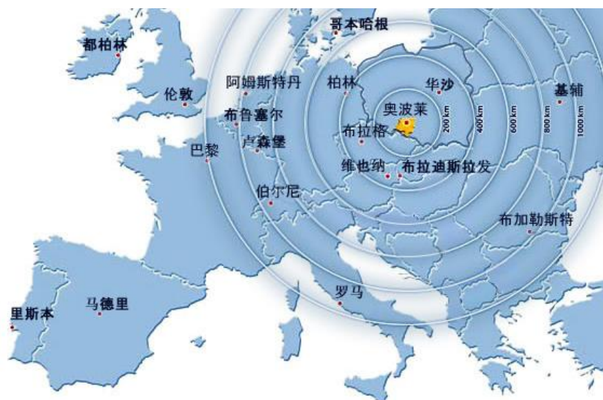
奥波莱省在欧洲的位置

奥波莱省位于波兰的西南部的西里西亚，临近捷克共和国和德国。从纯地理位置的角度来看，奥波莱省正位于欧洲的中心，其西部、北部和南部都是欧盟最具实力的消费市场。在运输方面，奥波莱省的铁路网络的密度是波兰全国铁路网密度的两倍，国际铁路贯穿东西南北。奥波莱省的公路设施是波兰所有省份中是最发达的。连接东西欧的 A4 号高速公路横贯奥波莱省，开通了 6 个出入口，驱车 3 小时即可到达德国首都柏林。A4 高速公路还连接着奥波莱省东西的两座与欧洲主要城市通航的国际机场（各约 100 公里）。此外，密集的水路运输网络也是奥波莱省的一个特色。