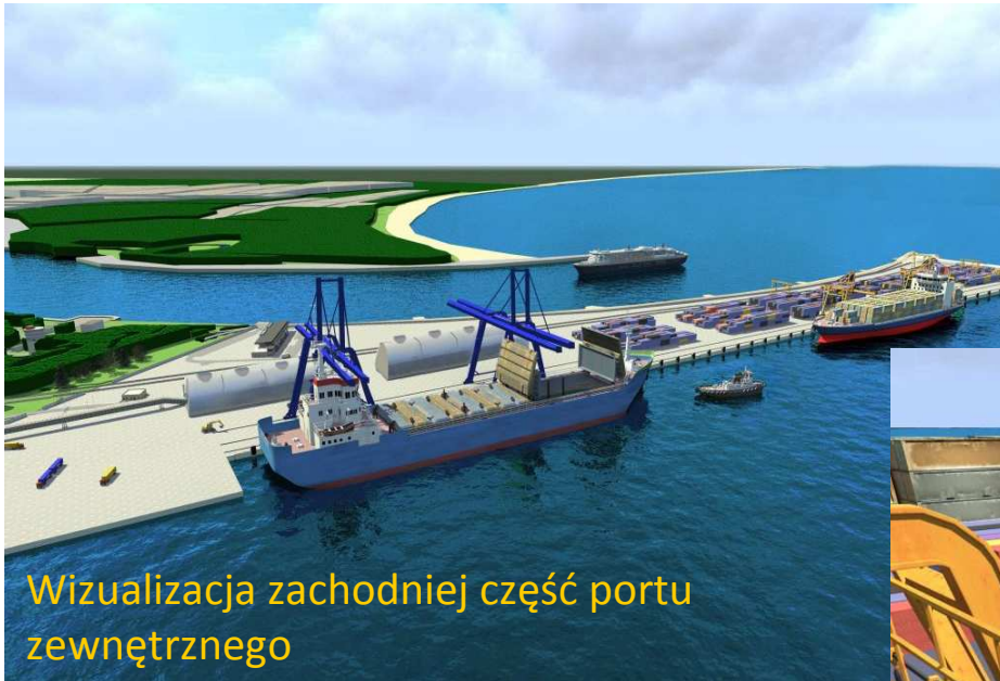
Wizualizacja zachodniej części portu zewnętrznego

Zachodnia część portu zewnętrznego (wizualizacja terminalu kontenerowego)