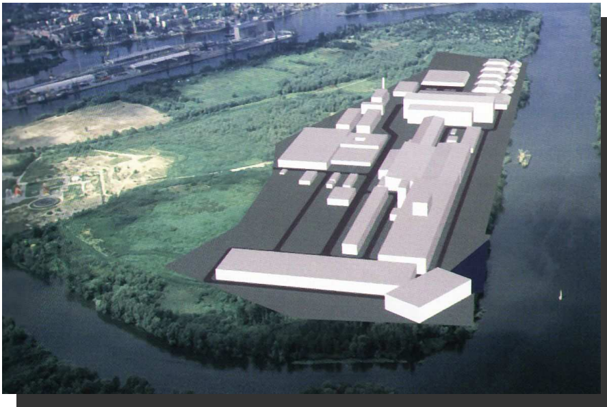
Wizualizacja przykładowej lokalizacji przemysłu przyportowego na wschodniej części Ostrowa Grabowskiego.